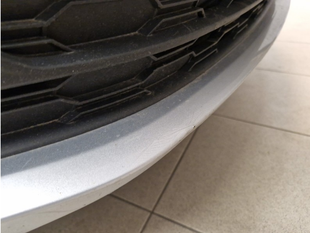
Vid' popis k poškodeniu č. 3