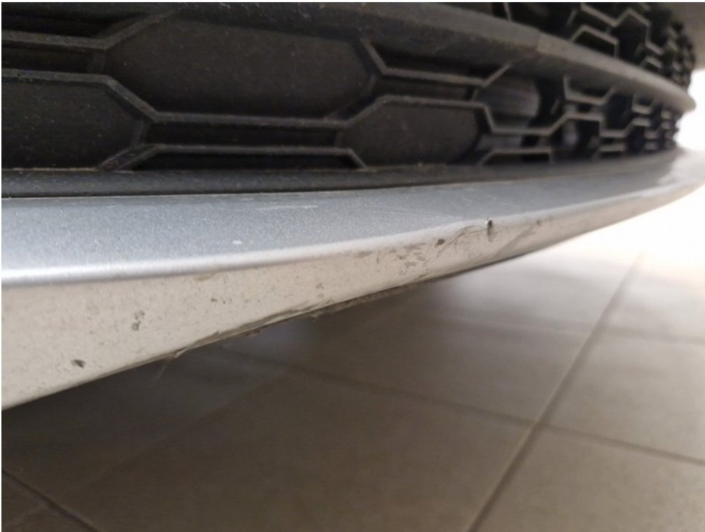
Vid' popis k poškodeniu č. 3