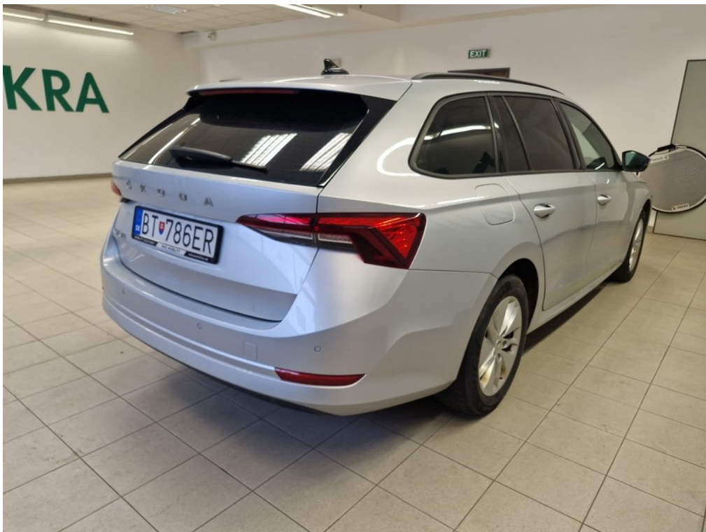
Pohľad zozadu sprava