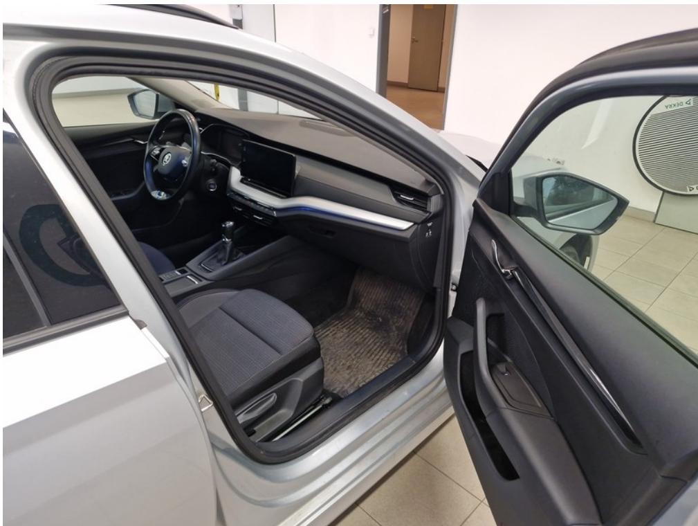
Interiér z pravej strany