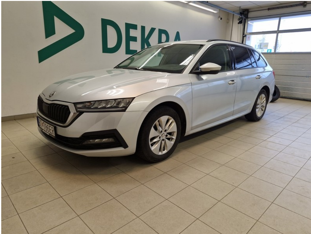
Pohľad spredu zľava