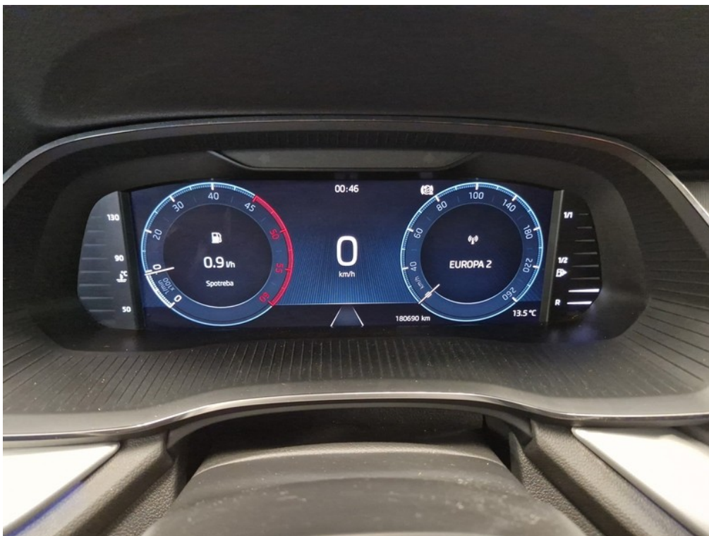
Prístrojový panel / stav tachometra