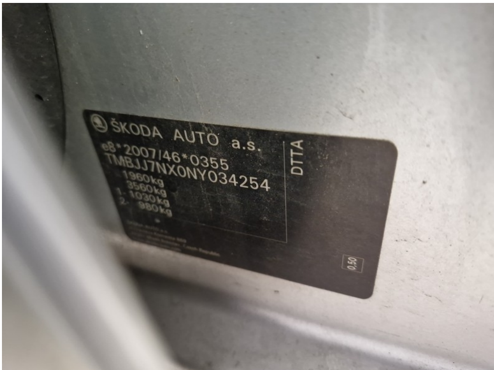
VIN / typový štítok