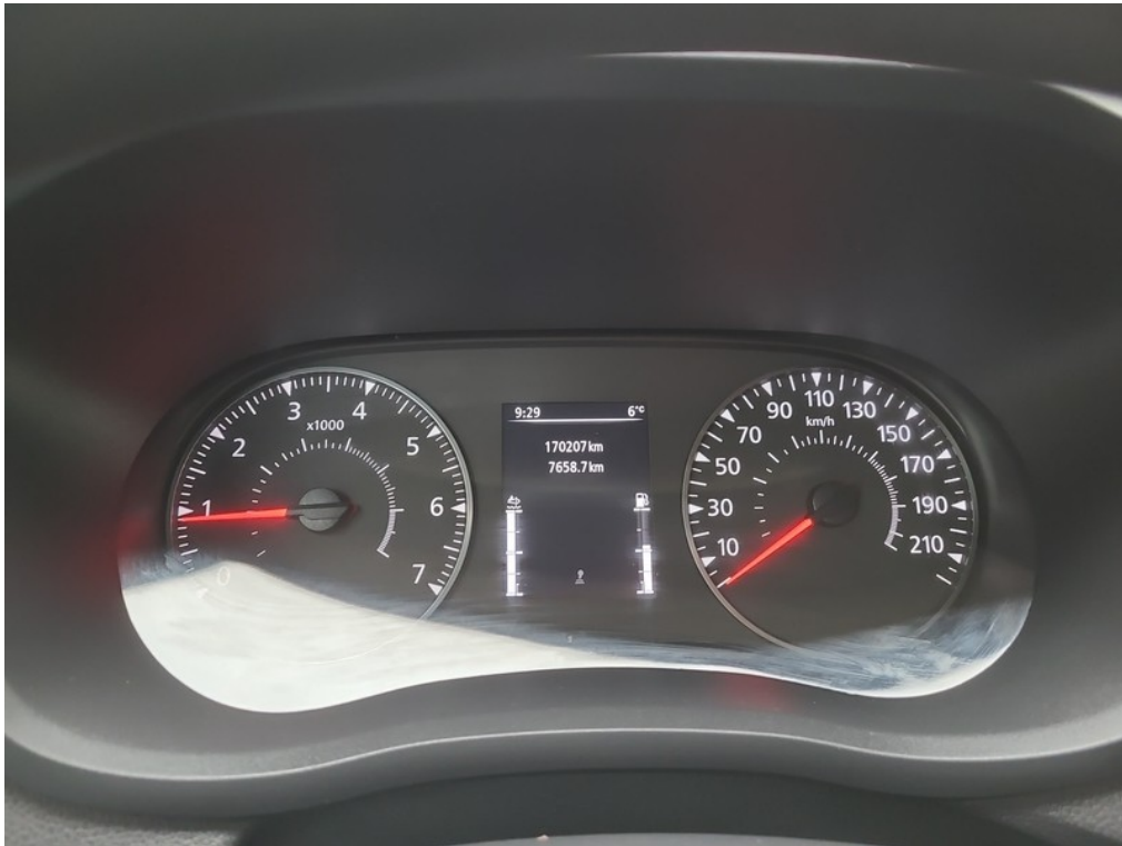
Prístrojový panel / stav tachometra