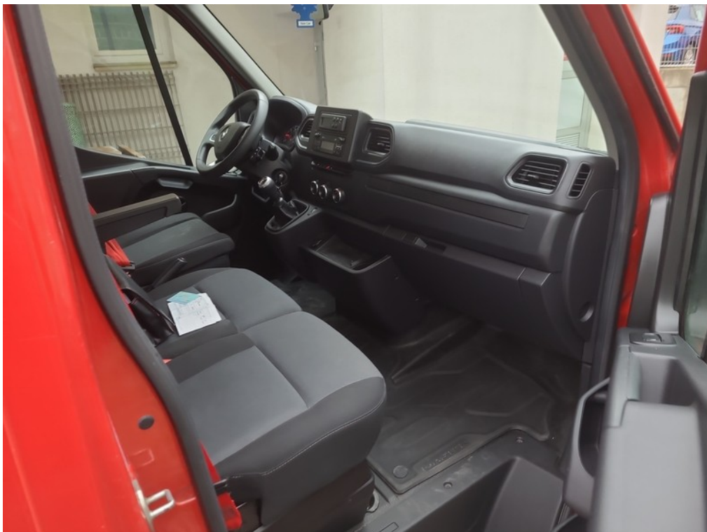
Interiér z pravej strany