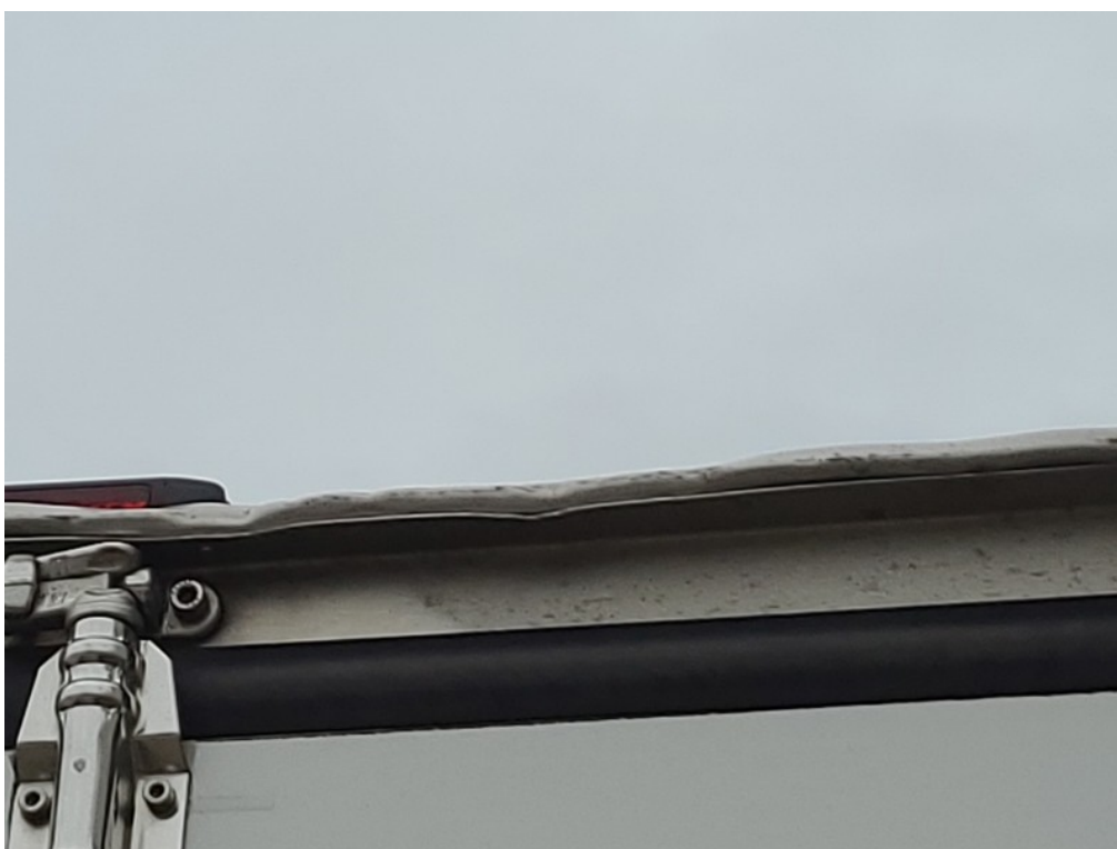
Vid' popis k poškodeniu č. 5