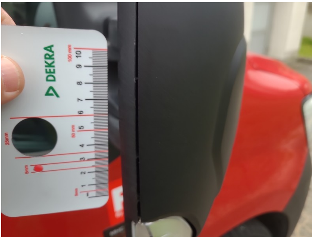
Vid' popis k poškodeniu č. 7