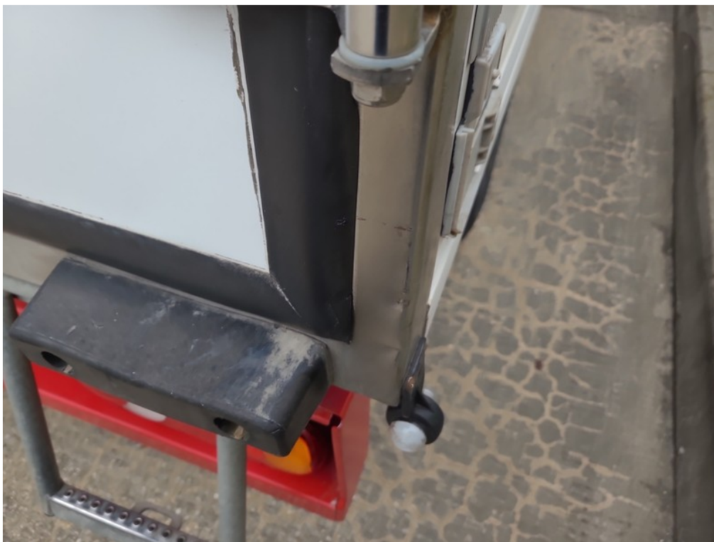
Vid' popis k poškodeniu č. 5