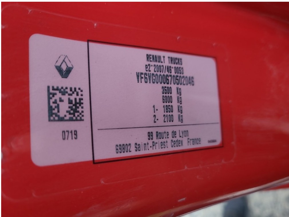
VIN / typový štítok