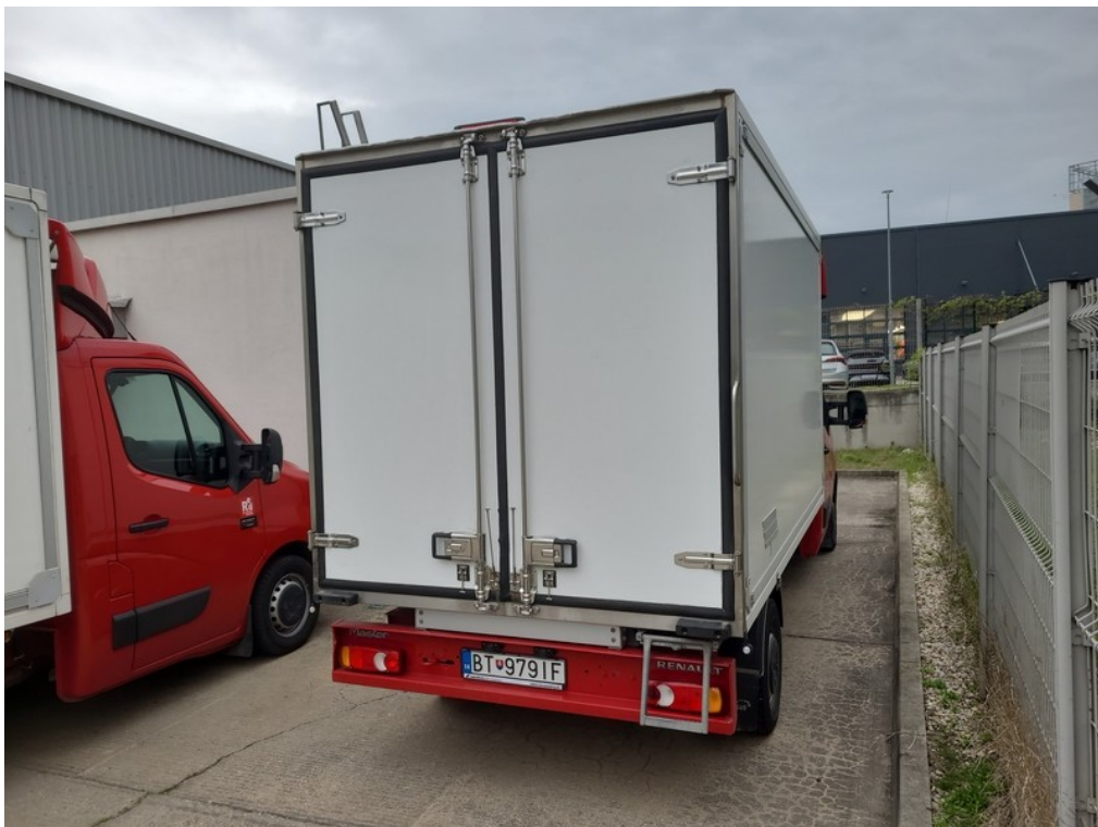
Pohľad zozadu sprava