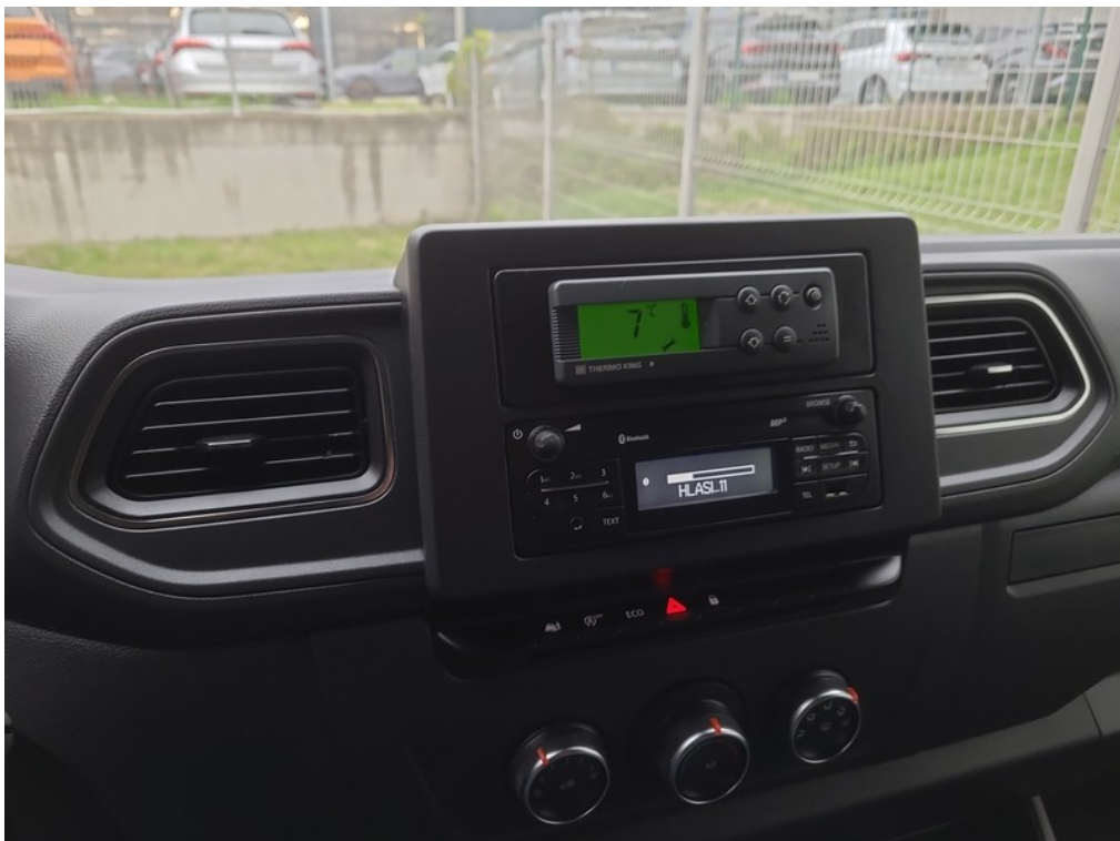
Prístrojový panel / stav tachometra