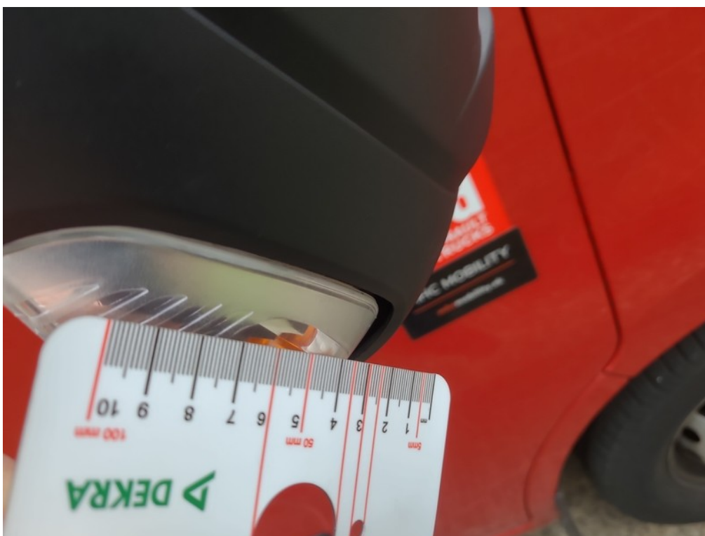
Vid' popis k poškodeniu č. 7