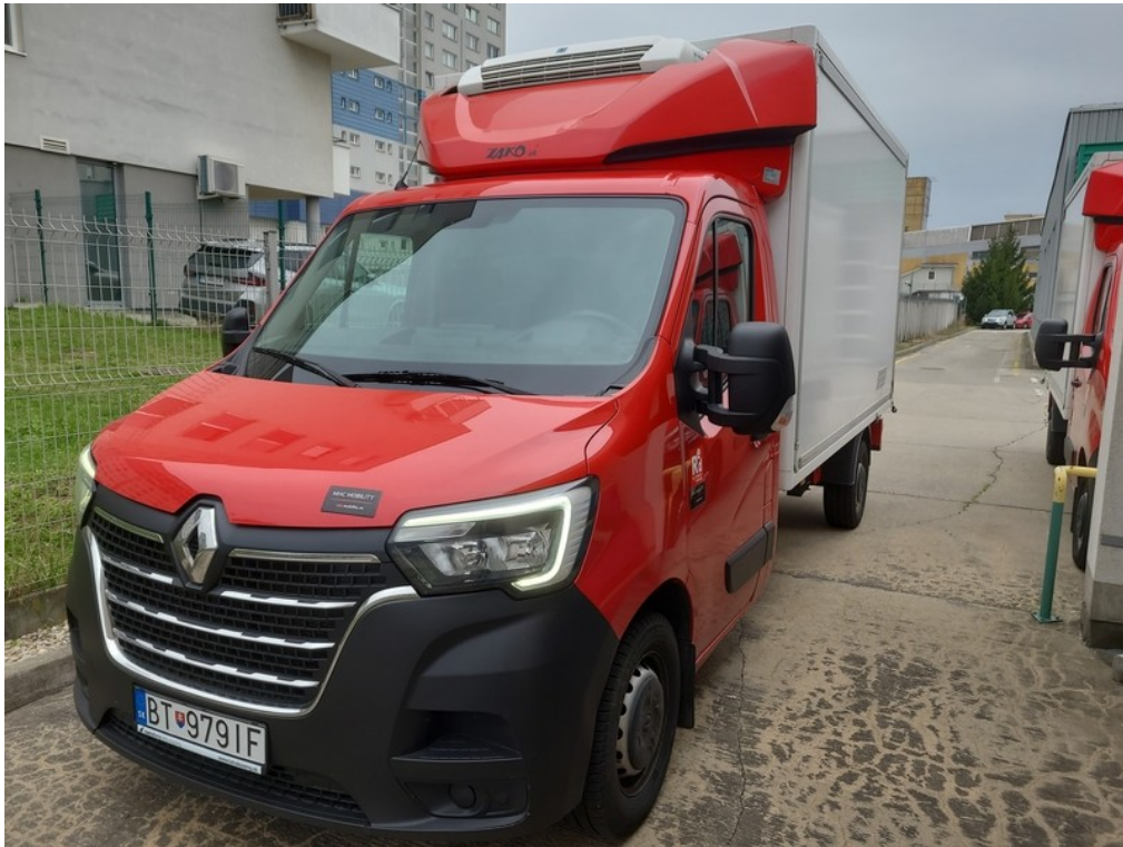
Pohľad spredu zľava