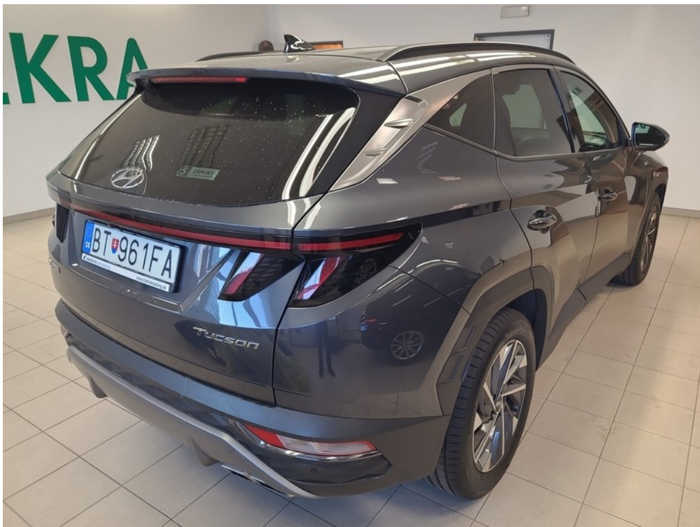
Pohľad zozadu sprava