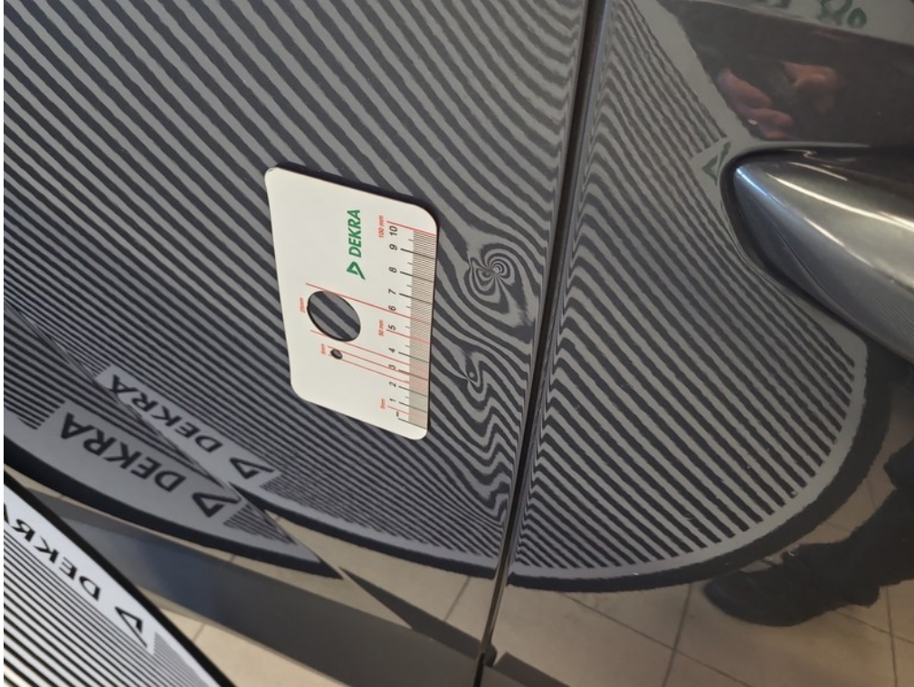
Vid' popis k poškodeniu č. 3