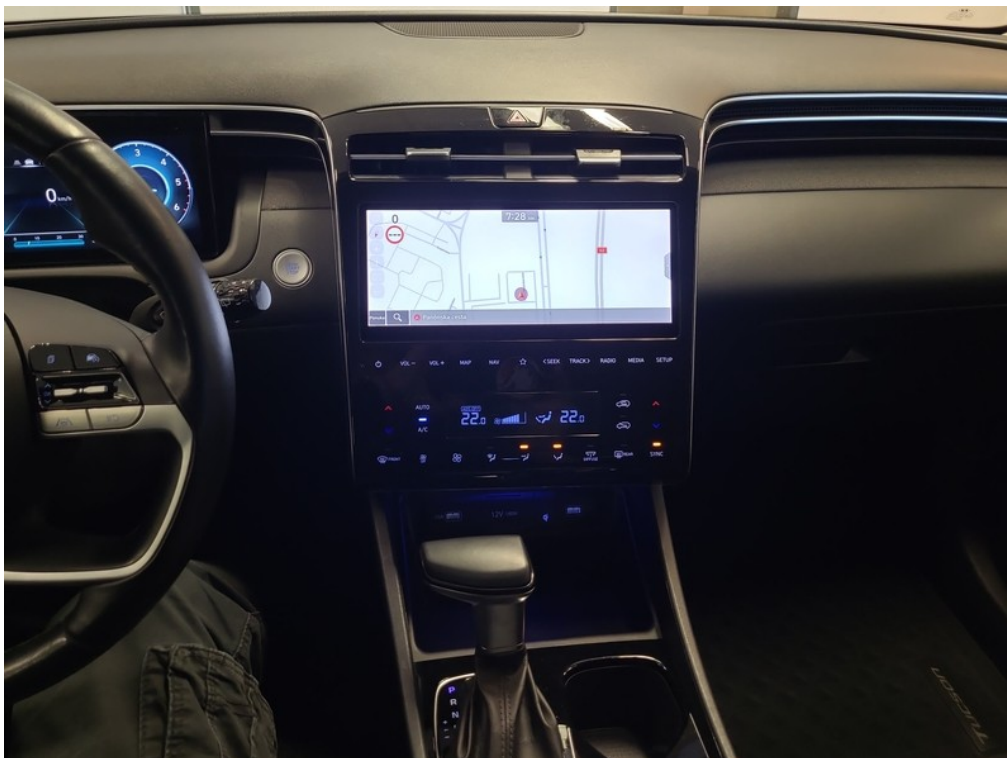
Prístrojový panel / stav tachometra