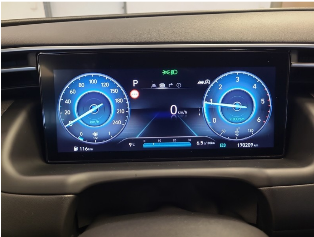
Prístrojový panel / stav tachometra