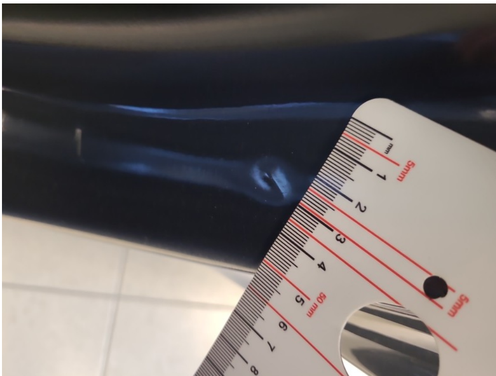
Vid' popis k poškodeniu č. 11