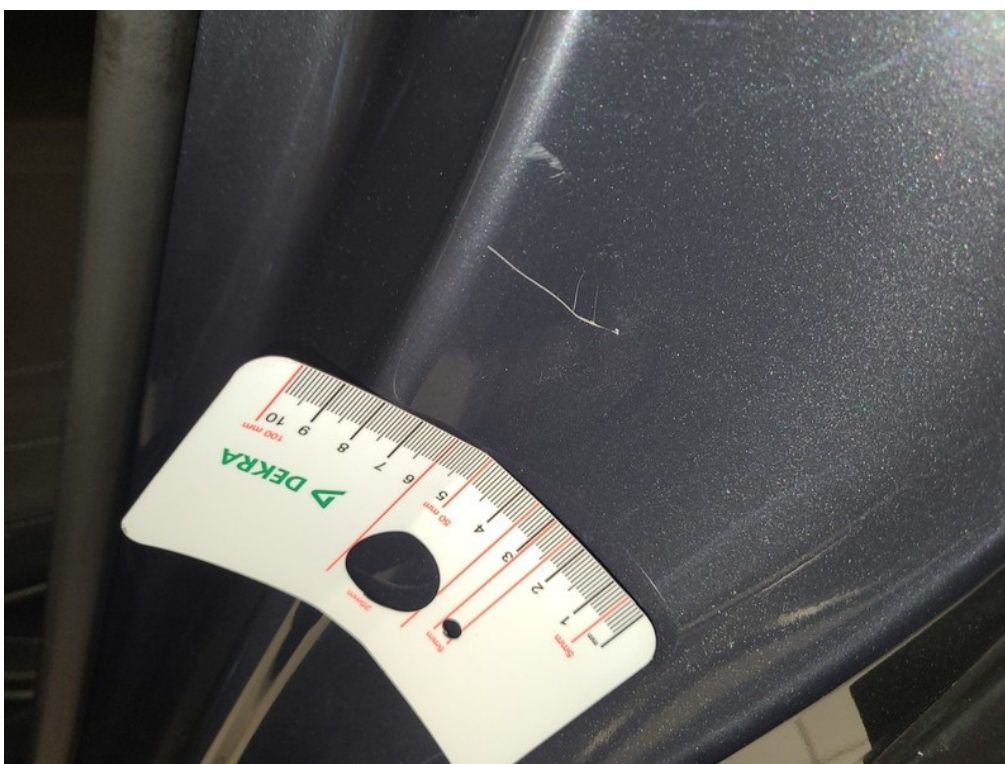
Vid' popis k poškodeniu č. 11