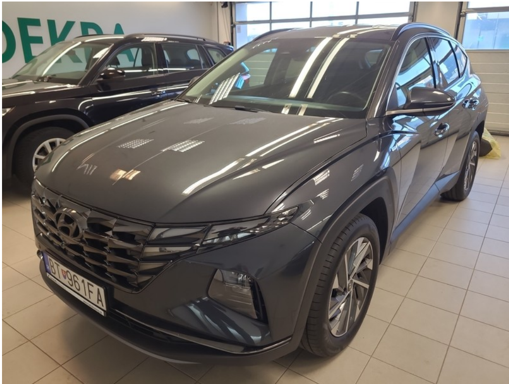
Pohľad spredu zľava