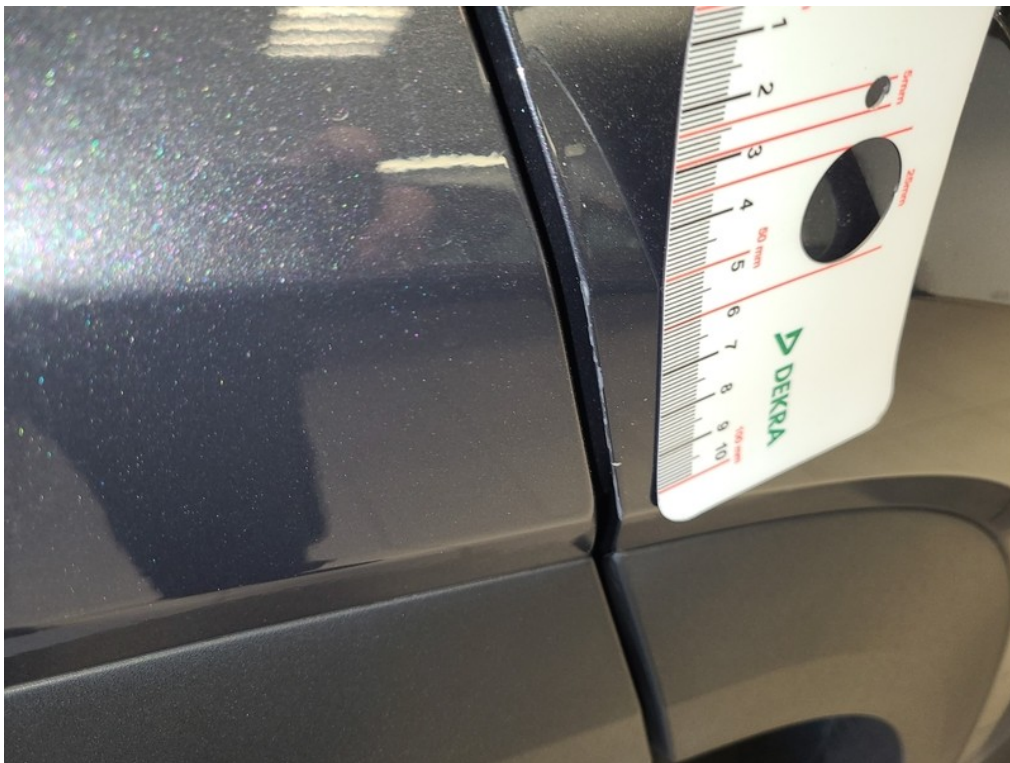
Vid' popis k poškodeniu č. 3