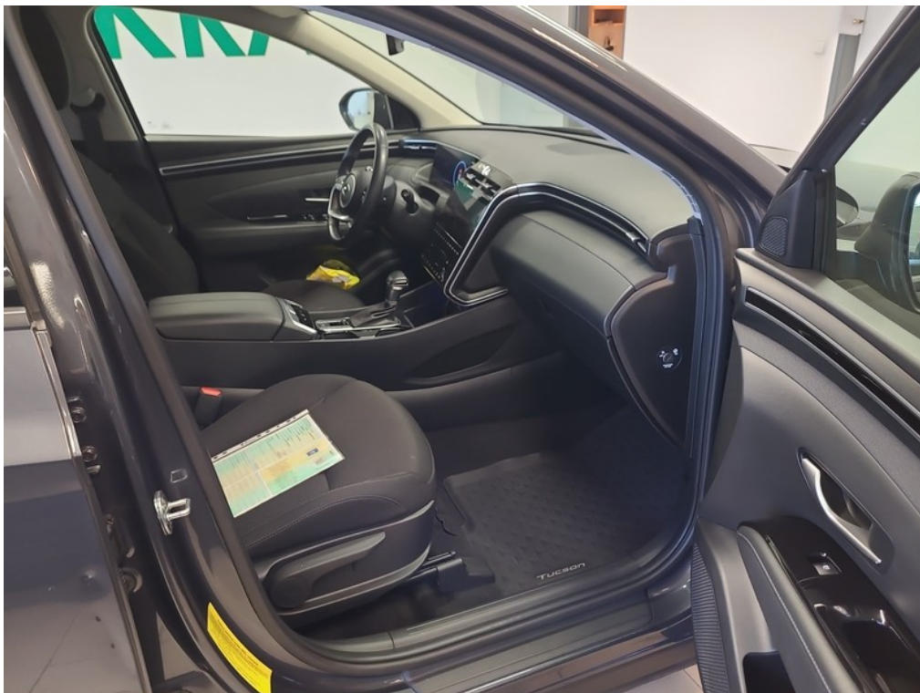
Interiér z pravej strany