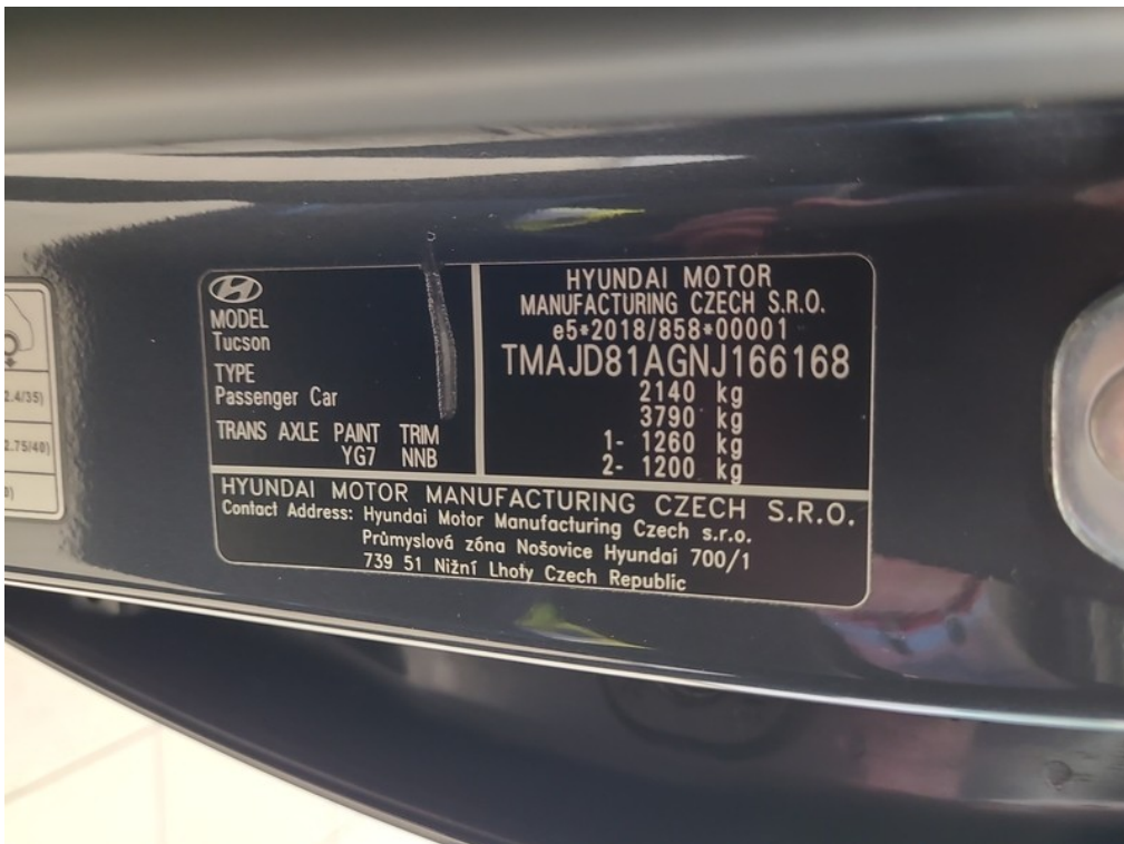
VIN / typový štítok